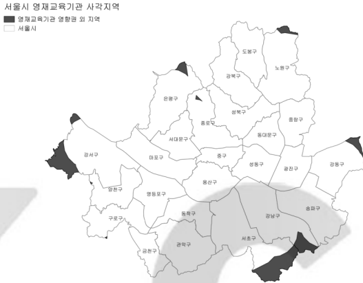
[그림 3] 영재교육 사각지역

이상의 도면을 기초로 영재교육기관의 도달범위를 중첩하여 영재교육이 공급될 수 있는 범위에서 벗어난 영재교육 사각지역을 도출한 결과는 [그림 3]과 같다. 서초구, 강서구, 강남구에서 상대적으로 영재교육 사각지역이 크게 나타났으며, 서울 주변부와 종로구에서 사각지역이 나타났다. 이는 서울시의 모든 영재교육기관을 고려하였을 때 영재교육 도달범위 내에 포함되지 못하는 지역이 있음을 의미하지만, 서울시 전체 면적의 4.02%로 실제 사각지역은 극히 적은 것으로 파악되었다.