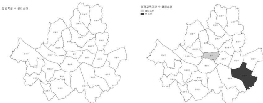
[그림 4] 영재교육기관 수와 일반학생 수의 클러스터 패턴

[그림 4]의 왼쪽에 제시된 일반학생 수의 국지적 모란지수는 통계적으로 유의한 값을 나타내는 구가 없는 경우로 나타나 전체적으로 그리고 국지적으로 모두 영재교육기관이 랜덤하게 분포되어 있다고 해석할 수 있다. 반면에 [그림 4]의 오른쪽에 제시된 영재교육기관 수의 국지적 모란지수는 통계적으로 유의한 값을 나타내는 구들이 있는 것으로 나타났다. 먼저 짙은 색으로 표시된 송파구는 영재교육기관 수가 많은 클러스터인 핫스팟으로 나타났다. 즉, 송파구의 영재교육기관 수는 서울시의 구별 영재교육기관 수보다 평균 이상의 값을 가지며, 통계적으로 유의한 양의 값을 나타내는 국지모란지수를 가지는 양의 공간적 상관관계를 보여주는 지역으로 해석할 수 있다. 한편 연한 색으로 표시된 중구는 영재교육기관 수가 적은 클러스터인 콜드스팟으로 나타났다. 즉, 중구의 영재교육기관 수는 서울시 보다 평균 이하의 값을 가지며, 통계적으로 유의한 양의 값을 나타내는 국지모란지수를 가지는 양의 공간적 상관관계를 보여주는 지역으로 해석할 수 있다. [그림 4]에 제시된 영재교육기관 수와 이를 이용할 가능성이 있는 추정 인구로 일반학생 수의 클러스터를 비교하면 일반학생의 경우 공간적으로 랜덤하게 분포되어 있지만 영재교육기관 수의 클러스터는 송파구와 중구에 나타남으로써 영재교육기관이 공간적인 분포의 측면에서 효율적이지 않은 곳이 있는 것으로 나타났다.