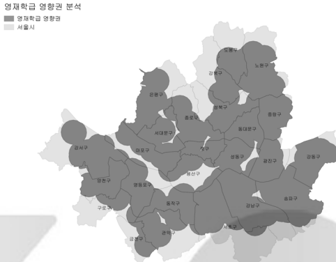
[그림 1] 1차 영재교육기관인 영재학급의 영재교육 도달 범위

되므로 더 작은 값을 기준으로 택하였다. 또한 교육청 영재교육원을 포함하는 2차 영재교육기관과 대학부설 과학영재교육원을 포함하는 3차 영재교육기관의 버퍼는 각각 직진 영재교육기관 버퍼의 두 배에 해당하는 3.0km와 6.0km를 적용하였다. 2차와 3차에 비해 상대적으로 좁은 이용권역을 적용한 1차 영재교육기관의 영향권을 분석한 결과 부분적으로만 사각지역이 확인되었다.